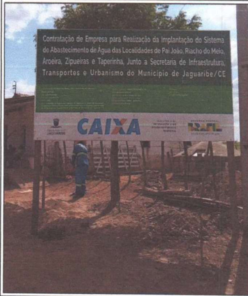
PLACA DA OBRA