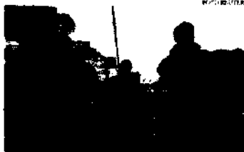
A ampliação proposta por Putin é de cerca de 10% do efetivo combatente, o elevando de 1,01 milhão para 1,15 milhão

Ninguém sabe exatamente quantas pessoas estiveram envolvidas na invasão da Ucrânia, mas a estimativa corrente é de que foram cerca de 200 mil homens em três frentes principais. Como se sabe, a desconfiança e falta de efetivos provocaram o fatiamento da guerra. Apesar de chegarem rapidamente aos combates de Kiev, as forças russas nunca ameaçaram de fato conquistar a capital, como parecia aparente em seu plano inicial. Assim, refrearam e se reagruparam para uma ofensiva, mais consistente no leste do país, o custoso Donbass que está na origem