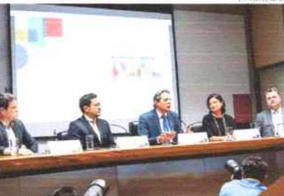
O ministro da Fazenda, Fernando Haddad, disse que o novo modelo impactará todo o comércio exterior brasileiro.

"Há a previsão de que o novo sistema também permitirá que os fluxos de cargas aéreas dobrem em até dois anos, através investimentos externos e ampliando a arrecadação federal relativa às importações do modal aéreo, de R$ 19 bilhões em 2021 para um novo patamar anual de R$ 38 bilhões", informou em nota o