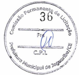
FRANCISCO ELDER CAVALCANTE BARROSO SECRETÁRIO DE EDUCAÇÃO E CULTURA