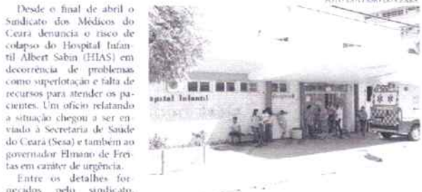
Profissionais relatam demora no atendimento de emergência mesmo quando há leitos vazios