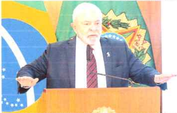
O presidente Luiz Inácio Lula da Silva coordena reunião de balanço dos 100 dias de governo. Todos os ministros participam da reunião

Para Lula, os investimentos públicos e privados e o financiamento das bancas para o desenvolvimento com inclusão social e sustentabilidade ambiental. A ideia do governo é facilitar o crédito a micros, pequenas e médias empresas e a cooperativismo, além de microcrédito para empreendedores individuais. Precisamos criar as con-