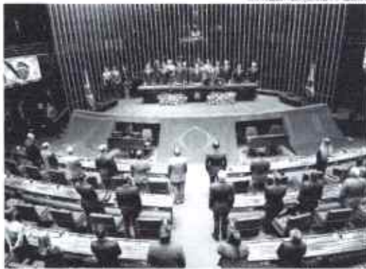
No Congresso Nacional, ainda há pendências sobre as presidências de comissões técnicas

A expectativa é de que um tempo entre propostas de indicação entre dois e três me-