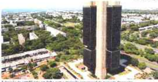
A decisão do copom do Banco Central em sua primeira reunião sob o presidente Luiz Inácio Lula da Silva...