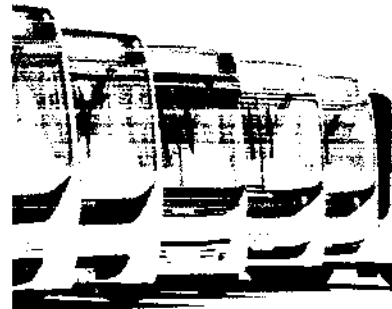
Foram implementados pelo Euter três pontos de parada entre a Rua São Paulo e a Avenida Duque de Caxias

Com o objetivo de melhorar a oferta de ônibus no centro de Fortaleza, desde setembro de 2021, a gestão de transporte urbano de Fortaleza também alterou o itinerário das linhas de ônibus 184 e 185. A decisão foi tomada em conjunto com a CDL para ampliar as linhas de ônibus das áreas de maior fluxo de passageiros no Centro e no Subcentro de Fortaleza.