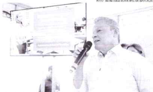
Mais de 11 mil professores devem ser beneficiados com a entrega dos microfones que serão usados em sala

Além disso, os professores também receberão um 'Cardápio', com o qual 18 mil profissionais poderão adquirir até R$ 200 em livros na Bienal do Livro de 2022, um investimento de R$ 3,6 milhões. Ainda na Bienal, os professores serão protagonistas como palestrantes apresentando experiências vividas que foram contempladas com o edital do