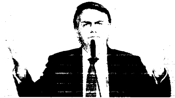
Bolsonaro faz ataques ao ex-presidente Lula (PT) e defendeu que a população possa comprar armas de fogo

STF (Supremo Tribunal Federal) Alexandre de Moraes, presidente do TSE (Tribunal Superior Eleitoral), de autorizar buscas contra empresários bolsonaristas gerou novos atritos entre o Planalto e o Judiciário a pouco mais de um mês das eleições.