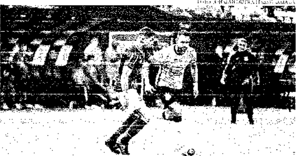
O Corinthians vai voltar a campo no próximo domingo para enfrentar o Santa André no estádio Brás. José Daniel

A estratégia do técnico de Corinthians com o domínio da posse de bola, buscando as