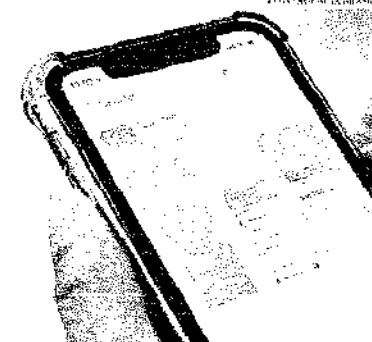
Os valores só podem ser movimentados por meio do aplicativo Caixa Tem, que permite o pagamento de contas domésticas

Para saber se receberá automaticamente o dinheiro ou se precisará pedir o saque, o trabalhador deve fazer uma consulta. O processo pode ser feito tanto no site fgts.caixa.gov.br quanto pelo aplicativo FGTS. O site informa apenas a data da