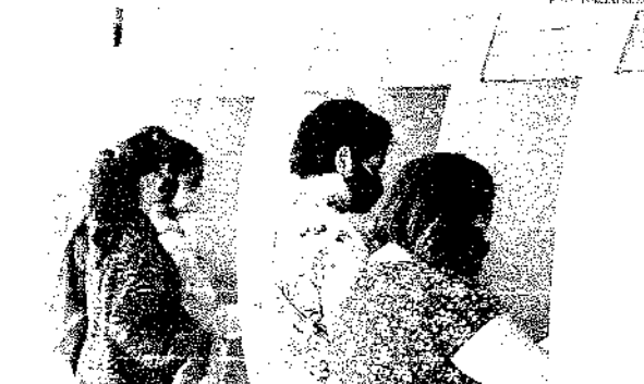
Consulta sobre o saque do FGTS pode ser feita via aplicativo da Caixa Econômica, pelo site ou direto na agência bancária

Inclusão: O Banco do Brasil oferece agora atendimento às pessoas com deficiência que usam serviços de acessibilidade. O serviço está disponível para as agências, a Central de Atendimento, o Serviço de Atendimento ao Cliente (SAC) e o Call Center. Inicialmente, em uma central especializada e usando os canais de atendimento por vídeo.