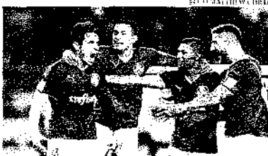
No momento, o Palmeiras espera o vencedor da partida entre Chelsea e Al-Hilal para saber o seu adversário na final pelo terceiro lugar.

O Palmeiras está perto de alcançar aquele que é seu grande objetivo. A equipe alvinegra é finalista do Mundial, nos Emirados Árabes Unidos, classificação obtida nesta terça-feira (8), com uma vitória por 2 a 0 sobre o Al Ahly, do Egito. Foi um jogo dos comandados de Abel Ferreira no estádio Al Nahrain, em Abu Dhabi. Raphael Veiga e Dudu se revezaram nos papéis de garom e artilheiro, comandando o triunfo do campeão sul-americano sobre o campeão africano.