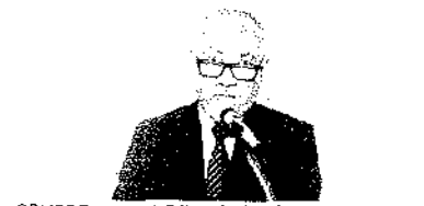
SEMPRE NA DELE. Hura foi de reclamar e não perde o paciência. Só deve sobre como e dirigir um clube grande sem apoio de ninguém. Cel. Pro. Gomes, hoje no colégio.

ATV Cidade mostrou segundo que passou melhor das mais interessantes envolvendo o garoto Samuel que é um talento no volei de praia. O garoto praticando o kateite e a natação.