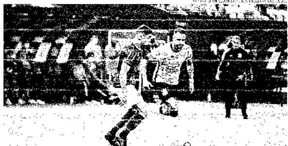
O Corinthians vai voltar a campo no próximo domingo para enfrentar o Santo André no estádio Bráulio José Daniel

A estreia do Corinthians na temporada 2022 não fez jus à expectativa criada em cima da equipe comandada pelo técnico Sylvinho. Pela primeira rodada do fase de grupos do Campeonato Paulista, a equipe alvinegra encarou a Ferroviária e ficou no empate em 0 a 0. A partida marcou o retorno do volante Paulinho ao campo após uma longa ausência pelo clube do Parque São Jorge. Favorito no confronto, o Corinthians dominou as ações do confronto do início ao fim, mas não conseguiu encontrar espaço no sólido sistema defensivo da Ferroviária, treinado pelo técnico Elano. A equipe do interior chegou ao seu 20º jogo seguido de invencibilidade, 15 deles sem sofrer gols, e até chegou a mandar uma zebra em Itaquera em dois lances de contra-ataque no segundo tempo.