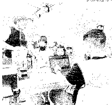
Consumidores puderam contar com o Feirão em diferentes formatos

Telefonia em destaque. De acordo com a gerente, durante o mês de março, os consumidores puderam contar com as ofertas do Feirão em diferentes formatos, tanto para aqueles que preferem uma experiência digital, por meio dos canais digitais da empresa, até o atendimento presencial, como a tenda física na cidade de São Paulo entre os dias 15 e 19 de março e a parceria com mais de 7 mil agências de crédito em todo o Brasil. "Além disso, anunciamos pela primeira vez o formato drive-thru