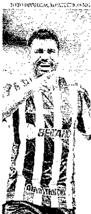
Até o momento, a equipe não se reuniu com os representantes do atleta para começar as negociações

Contratação. Philippe Coutinho acertou transferência para o Aston Villa, da Inglaterra. O meia-campista vai para o clube inglês por empréstimo até o fim da temporada. Ele pertence ao Barcelona, mas recebe um salário muito alto e o time catalão está com dificuldades financeiras.