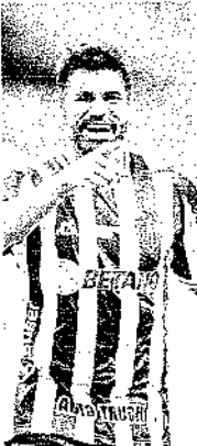
Até o momento, a equipe não se reuniu com os representantes do atleta para começar as negociações

O clube já consultou seus parceiros comerciais e recebeu um sinal positivo para iniciar as conversas com o centroavante.