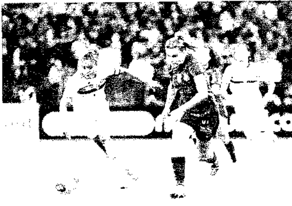
Com o resultado, o Corinthians se transformou em tricampeão do torneio estadual de forma invicta

O Corinthians fez história nesta quarta-feira (8). Diante de 40.677 torcedores, o maior público já registrado no país em uma partida de futebol feminino entre clubes, o Timão derrotou o São Paulo por 3 a 1, na Neo Química Arena, para conquistar o Campeonato Paulista pela terceira vez, todas de forma consecutiva. O Tricolor havia ganhado o jogo de ida, no último sábado (4), por 1 a 0 no Morumbi.