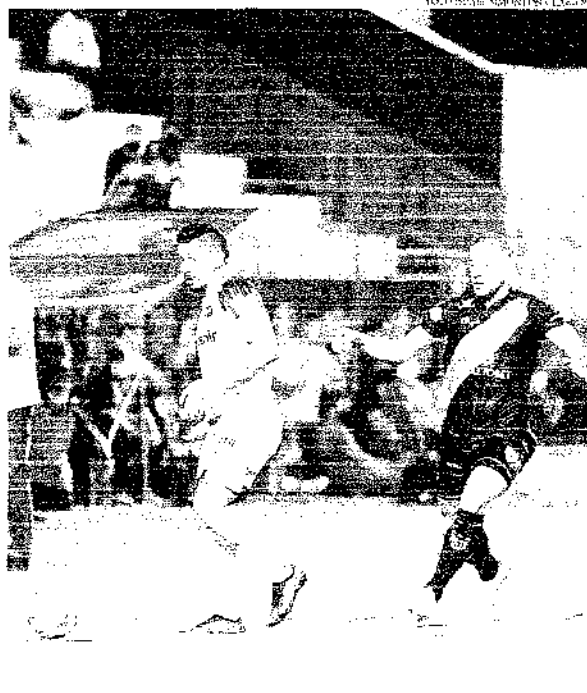
A próxima partida do Ceará será na próxima quinta-feira contra o Corinthians, na Arena Castelão