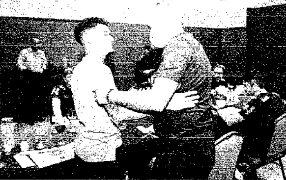
O primeiro atleta que faz a sua apresentação foi o atacante Philippe Coutinho que joga pelo Barcelona

Na época da convocação, o coordenador da seleção lumininha Paulista informou que