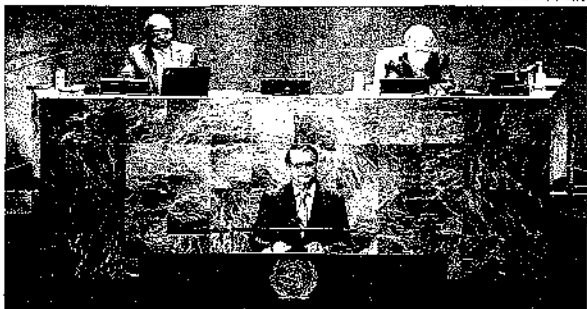
O presidente brasileiro Jair Bolsonaro na ONU. O país recuperou sua credibilidade externa

Falando sobre as estatísticas e investimentos feitos no Brasil, Bolsonaro afirmou que elas "deixam prejuízos de bilhões de dólares no passado, hoje são lucrativas. Nesse Banco de Desenvolvimento era usado para financiar