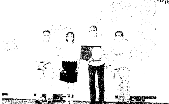
Solenidade contou com a presença de Paulo Henrique Lustosa, Izolda Celso, Camilo Santana e Zezinho Albuquerque

O Programa Águas do Sertão é desenvolvido pelo Governo do Ceará, por meio das SCidades, com o objetivo de reduzir a vulnerabilidade e fortalecer a resiliência da população rural cearense às secas e à escassez de água, melhorando as condições de saúde e qualidade de vida, através da implantação de soluções de abastecimento de água e esgotamento sanitário, ao mesmo tempo em que tem como objetivo consolidar o Modelo de Gestão SISAR com ações de capacitação, treinamentos e fortalecimento de sua infraestrutura. Ges-