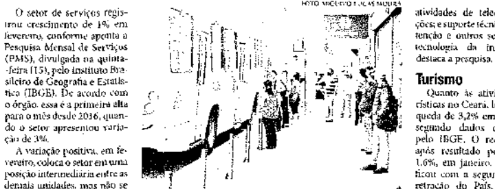
Embora o resultado positivo, setor de serviços recuou 8,6% na comparação de fevereiro de 2020 e 2021

Esta foi a primeira alta para o setor desde 2016, conforme pesquisa do IBGE. Estado ficou em posição intermediária em relação aos demais