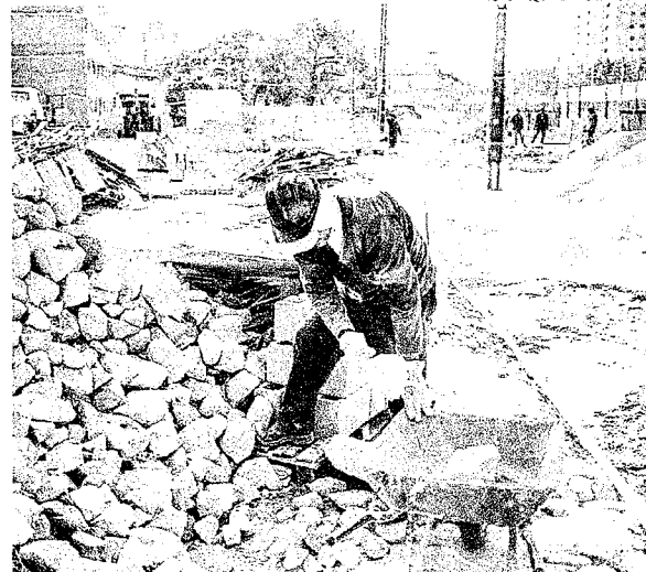
Segundo Sinduscon-CE, de quase sete mil funcionários, 320 foram contaminados com covid-19 em Fortaleza

Setor reitera que o uso de máscaras e álcool em gel são obrigatórios e que não há como ter aglomeração dentro dos canteiros de obras