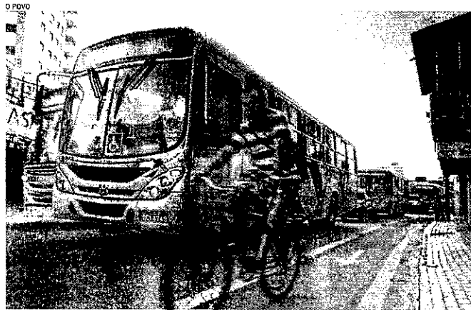
A TROCA de ônibus por outros modais também impacta no recuo do número de passagens pagas

"Quando tenho uma distância de três quilômetros, prefiro ir de bicicleta e economizo tempo para fazer outras atividades no dia. Pedalar é uma atividade física e quando chego nos destinos estou mais apto".