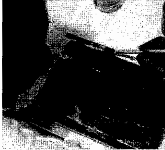
REDE de Atenção Psicossocial estaria ameaçada com mudanças

Conselho Nacional de Secretarias Municipais de Saúde (Conasem), além de órgãos do Ministério da Saúde. Ainda segundo Silva, a portaria no 3,688, de 21 de dezembro de 2017, — que dispõe sobre a Rede de Atenção Psicossocial — "não seria mantida".