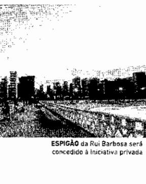
ESPIGÃO da Rui Barbosa será concedido à iniciativa privada