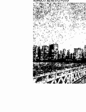
ESPIGÃO da Rui Barbosa será concedido à iniciativa privada