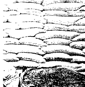
Em 2019 , foram feitos 271 mil pedidos. Esse ano, até a sexta, 22 foram registrados cerca de 130 mil

produção deste ano. Já que tivemos mais alimentos para o rebanho? Espero Neyra Jáge.