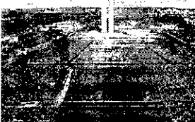
O BRASILEIRO "Democracia em Vertigem" foi indicado ao Oscar de Melhor Documentário