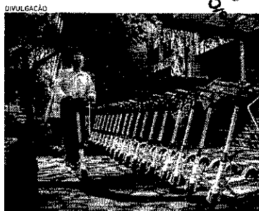
PATINETES e bicicletas elétricos são opções para viagens de curtas distâncias

Pelo decreto municipal número 14.393, a micromobilidade tem por intuito, principalmente, integrar esses modais às demais redes de transporte da Cidade, incentivar deslocamentos de curtas distância e duração, ordenar os movimentos urbanos e promover segurança viária.