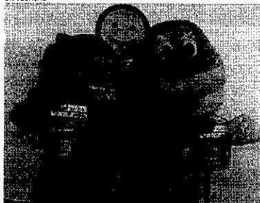
MASCOTES DOS Fortaleza e Ceará participaram do lançamento do projeto