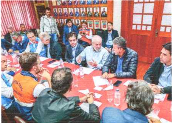
O governador Eduardo Leite pediu que fossem criadas linhas especiais de crédito para 300 municípios

O vice-presidente do Supremo Tribunal Federal (STF), Edson Fachin, por sua vez, disse que a corte vai trabalhar na criação de um regime jurídico "especial e transitório" para o Rio Grande do Sul. "Aqui estamos para manifestar, mais do que a nossa solidariedade, aqui estamos juntos, o Judiciário está junto com os demais Poderes da República e estará junto especialmente na perspectiva de