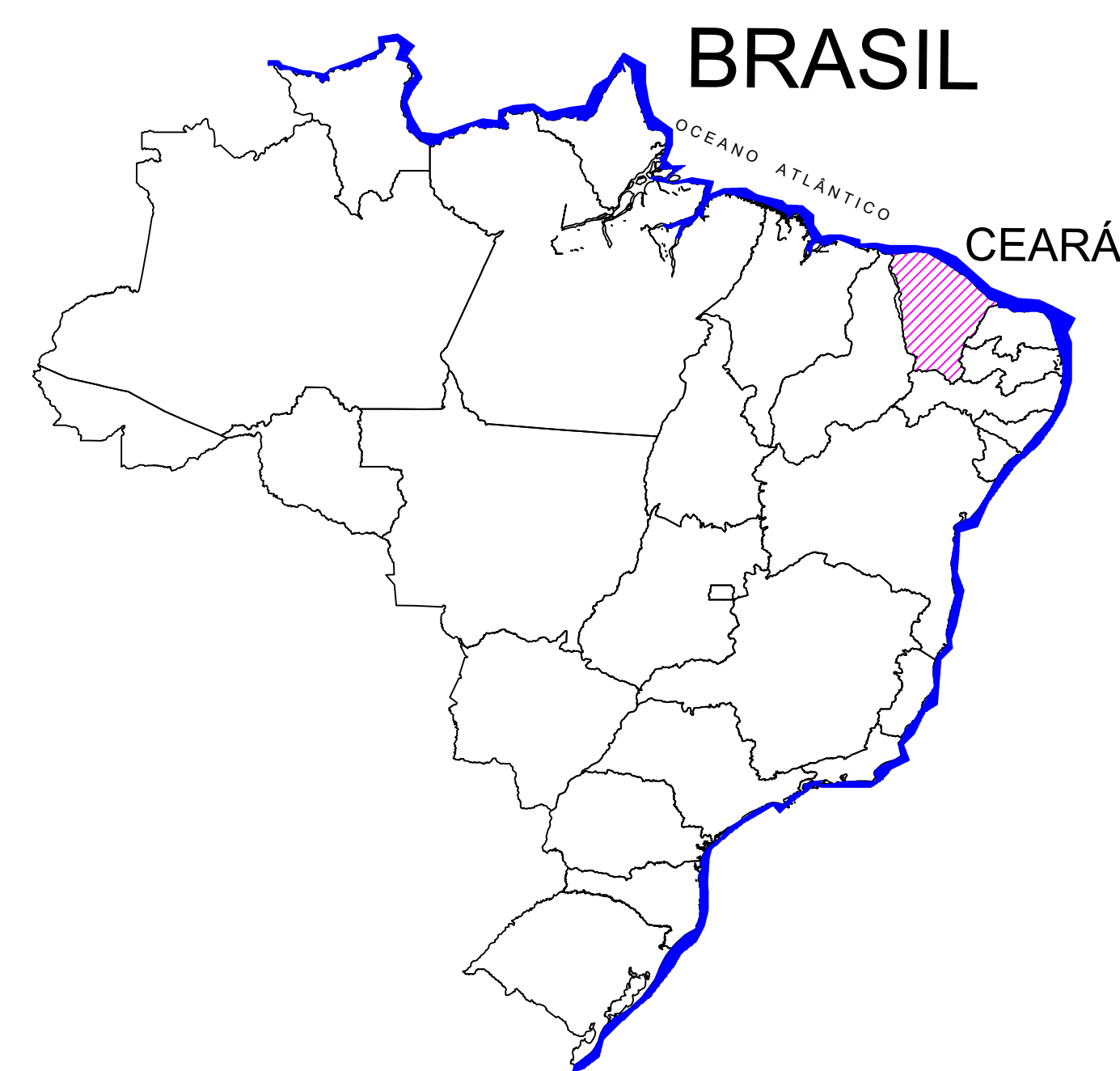
SITUAÇÃO PAÍS - ESTADO