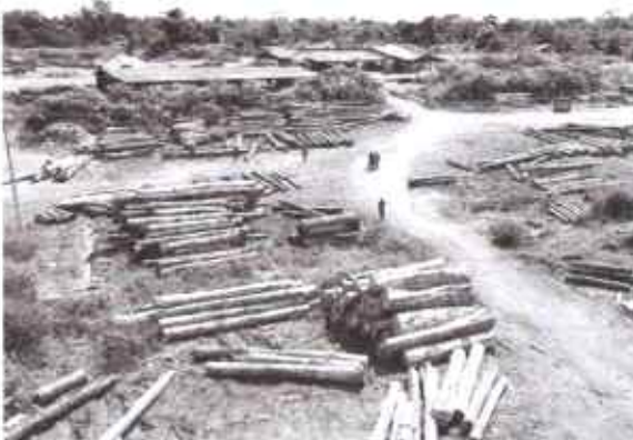
A grande maioria dos invasores e do gado já foi retirada dos territórios; imóveis vêm sendo destruídos