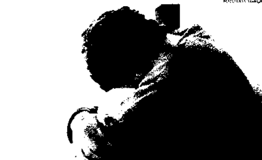
O CRP-CE explica que barreiras sociais podem impedir o acesso aos serviços de apoio psicológico

Além do tabu e do estigma negativo que muitas vezes é imposto sobre o cuidado com a saúde mental, o CRP-CE também alerta para a existência de barreiras culturais, econômicas e sociais que podem impedir o acesso à população, principalmente em situação de vulnerabilidade social, aos serviços de acompanhamento emocional. "O Brasil vol-