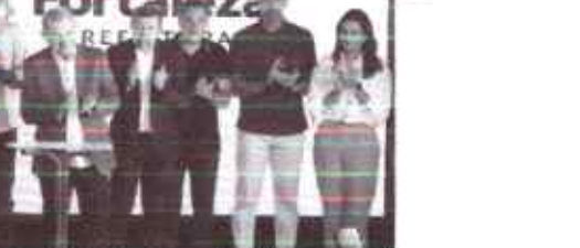
O acesso da população dos espigões contemplados continuará livre e gratuito